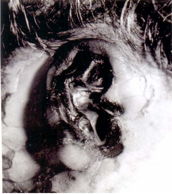
Resim 2. 17 yaşında diabetik ketoasidozlu kadın hastada aurikula, dış kulak yolu ve komşu boyun cildinde nekroz gelişmişti. Aynı taraf yüzde fasial paralizi gelişmişti.